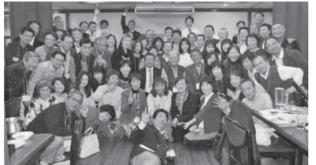
当初、男子42名女子28名と二宮金吾先生の総勢71名での開催予定でしたが、64名が集まりました。返信のあった168名のうち参加可能だったのが64名です。知りえる限りの同期生に連絡しましたが、100通余りが宛先不明で戻ってきました。

2017年11月11日、午後2時から、大阪お初天神通りのミュンヘン本店で22期の還暦同期会を開催しました。どこかのホテルでも考えましたが、『気持ちも着こなしも氣樂に！』を基準にしました。