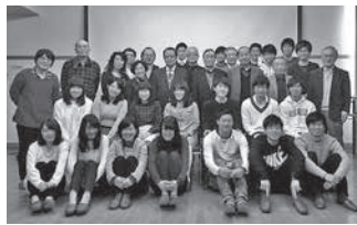
本年度卒業生・新入会員歓迎会

ルに触れて、しばし高校時代のバスケットマンに戻ったひと時を楽しんでもらいます。詳細は来年の「旭窓」にて紹介いたします。