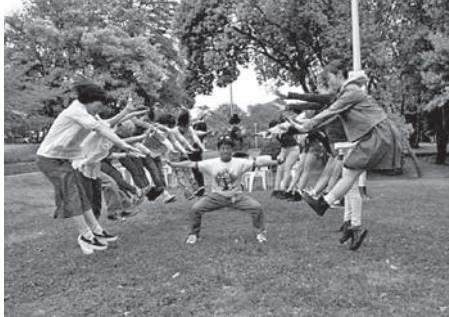
(この写真は昨年のものです)