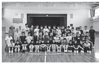
合宿支援金手交時の集合写真

総会に先立ち、体育館で現役生の練習見学、OB・OGと現役生の交流戦、フリースロー大会なども実施します。体育館のコートに立ち、バスケットボー