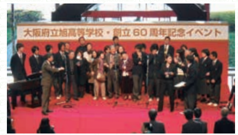
先生・卒業生・在校生と一緒に 丹光輝く ああ 旭窓