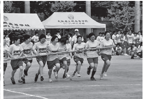
(黄色テントは 61・21期生の卒業記念品)