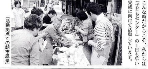
(活動拠点での朝市風景)

高専で中高生の居場所づくりを 劇場活動から、中高生の居場所がない、それが必要だということに気づきました。劇場が母体となり「子どもセンターあさひ」を作ろうと、子どもセンター建設委員会を立ち上げました。大阪府からもNPO法人認証を受けています。建設予定地は、母校近くの高専です。 今年3月、この運動を1人でも多くの人に知ってもらい、賛同して頂けるよう、子どもセンターオリジナルCD「あるがま