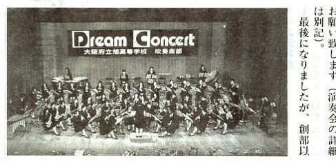
Dream Concert 大阪府立旭高等学校 吹奏楽部

いすに臨みました。丁度三年生の水泳部の仲間が応援にかけつけてくれました。前半からビスタを上げ、後半は手足に疲れを感じたが必死に泳ぎゴールを切ることが出来、翌日の決勝は自己ベストで五位に入賞しました。又、大会前に岡山で合宿中の一、二年生より応援のビデオを贈られ期待に応えることが出来ほつとしました。今まで味