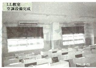
LL教室 空調設備完成

設置された視聴覚教室が、平成5年11月に視聴覚教室が設置され、授業をはじめ諸行事や生徒会活動・部活動に活用され、各週平均24時間の使用頻度となり、他の府立高校の視聴覚教室の利用実態と比べて、最も頻りに利用されている学校であると思われまふ。