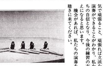
伝統舞の練習風景

（二〇期）バレー部OB 居相 筆曲部 私たちが筆曲部は、今年度より「全国高等学校総合文化祭」に出場しました。文化部に所属出来た方、この大会は、文化部にとっても、インテリゲンシアにあたるもので、都道府県を代表する学校が集まり、演劇・放送・日本音楽・吹奏楽・写真・書道など多くの部門にわかれ、それぞれ競うもので、私自身は、全国単位の大会は初めてだったので、出場できてよかった。大変うれしく思っています。一方で、府の代表としての周りの期待を感じて、中途半端な演奏はできないというところ、たくさん不安や焦り、プレッシャーも感じました。 さて、私たちが選んだのは、「紺碧（あおく）」という曲で、古典の曲は全体的にタイプのとともテンポの良い曲です。とてもいい曲なのですが、そのぶん難しきところが多くて、大金直前まで、焦りながら一生懸命練習していました。練習を重ねていく間に、チームワークや音楽を技術、他人に頼らず自分自身でしっかりと弾きこなすことなど、たくさん