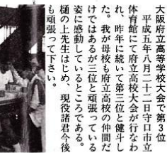
ジャズ演奏の様子

旭高校 高バレー部 高い知性と豊かな情操の教育を目指して 伝統の普通科と新しい時代の国際教養科 大阪府立高等学校大会で第3位 平成五年八月二十二日宇市立体育館にて府立高校大会が行なわれ、昨年に続いて第三位と健闘しました。我が母校が府立高校の仲間だけではないと三位と頑張っている姿に感動しているところである。この大賞をいただき、現役諸君今後頑張ってください。