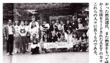
高野山でのサマーキャンプの様子

視聴覚教室とLAN教室 これから最終の詰りをしまして、いよいよ、皆様方にご援助をお願いするところになる場合も考えられますので、ご 「LAN教室とパソコン教室」は南館三階東端の教室を改造して設置されます。情報処理教育の充実と推進に寄与するために最新の機材が導入されることになり、NECのPC-9800シリーズが四十六台設置され、同時に機器の保全のために空調設備も完備されます。 設置工事は年末に予定見込みです。学校の施設や教育の内容等について、機会がございましたら、母校へ足を運んで、実際に見て頂きたいと思っております。